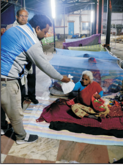
উলুবেড়িয়া জোন কর্তৃক ফ্রি র্যাপার ডিস্ট্রিবিউশান