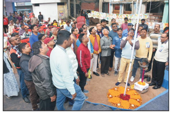
সার্ভিস টু হিউম্যানিটি অনুষ্ঠান বালুরঘাট জোন, দক্ষিণ দিনাজপুর ১২।০১।২০২৫, রবিবার