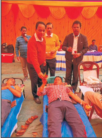
রক্তদান শিবির (এগরা জোন, পূর্ব মেদিনীপুর জেলা)